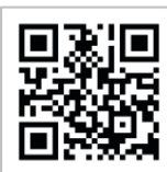
サピックスキッズHP